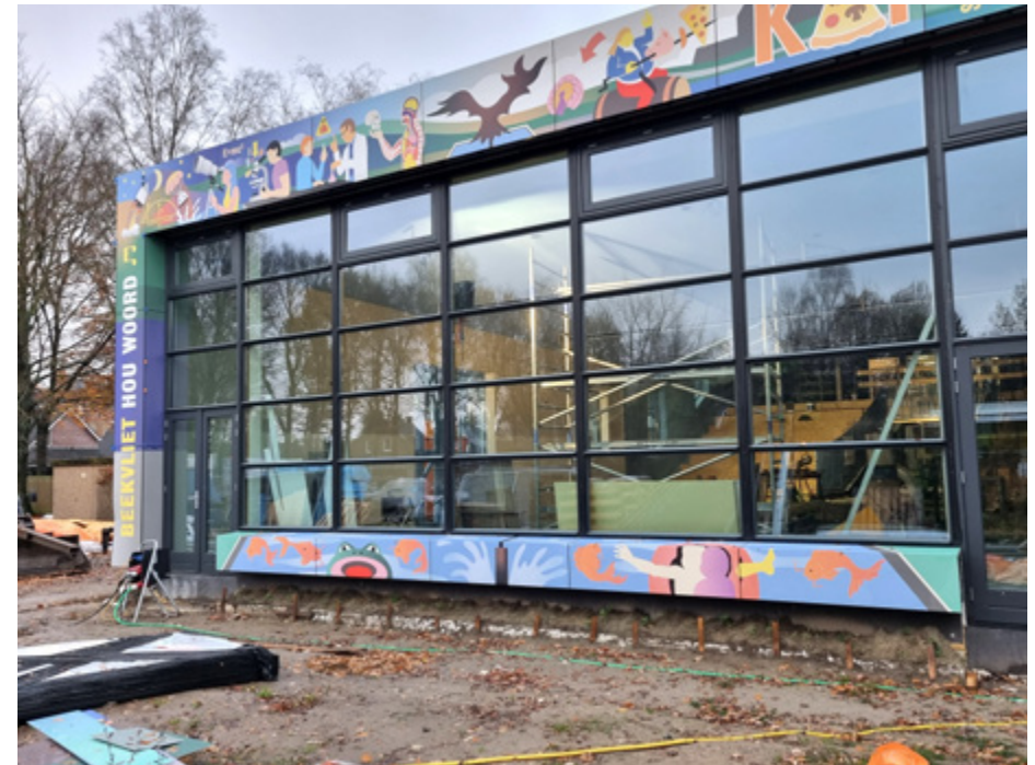
De stand van zaken begin december: de buitengevel al zichtbaar, maar binnen wordt nog hard gewerkt

een dubbelfunctie voor de leerlingen kreeg: zowel studiehuis als aula. Het was allemaal net op tijd gereed voor de ontvangst van de leerlingen op dinsdag, maar het bleek wel een voorbode voor een woelige verbouwingstijd: in de maanden september tot december zijn achtereenvolgens de kantoren en personeelskamer, de garderobe en