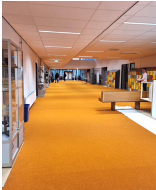
De oranje Via, waar ooit studiezaal en studiehuis waren

Op de eerste maandagochtend werd de algemene personeelsvergadering zelfs noodgedwongen vervangen door ‘werk in uitvoering’, waarbij de lokalen aan de Via door de docenten en OOP'ers werden schoongemaakt en voorzien van meubilair. Ook de gymzalen werden alternatief ingericht: de ene zou een tijdlang als personeelskamer gaan fungeren, terwijl de andere zeker tot Kerst