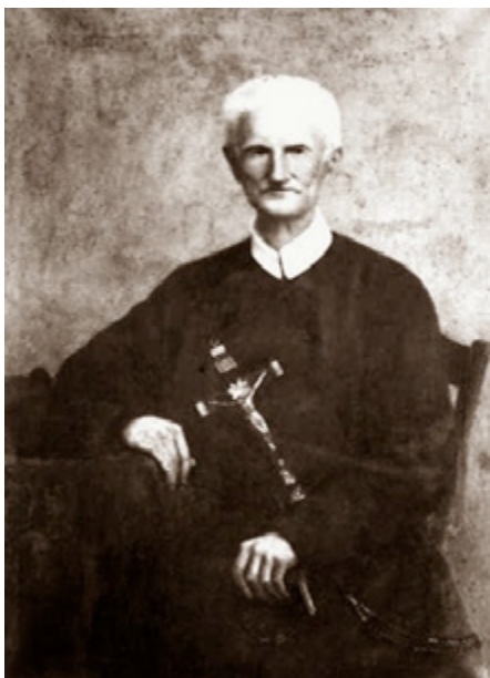
Peerke Donders, foto ca 1880, bron: Wikipedia

beelden die ongelijke raciale verhoudingen weerspiegelen. In Tilburg staat een schilderij en standbeeld van Peerke Donders ter discussie. Aan zijn voeten, tegen hem opkijkend, zitten tot slaaf gemaakte mensen.