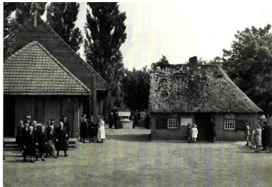
Bedevaartgangers bij kapel, waterput en geboortehuisje van Peerke Donders. Jaren veertig van de 20e eeuw.

Toen Peerke in september 1831 op Beekvliet aankwam oordeelde de regent dat hij te weinig ondergrond had voor de opleiding en derhalve voorlopig alle plannen om te gaan studeren maar moest laten varen en gewoon als huisknecht dienst moest gaan doen. Op kleinseminarie Beekvliet werd mij nog het hok aangewezen waar Peerke als knecht doende was geweest. Peerke reageerde lijdzaam op deze onverwachte tegenslag. Na een half jaar besloot