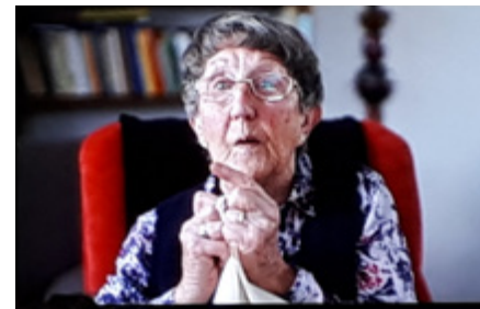
Blommaart toont hoe ze berichten verstopte in een borduurwerkje

rie waar de Duitsers het kamp hadden ingericht in de oorlog. „Gelukkig heb ik wat beelden van voordat Haarendael door brand werd verwoest. (...) De brand was een ramp voor Haarendael, maar voor het verhaal van de film kreeg alles na de brand nog meer waarde." Preview van de film: Documentaire Kamp Haaren eindelijk te zien | Meierij | bd.nl