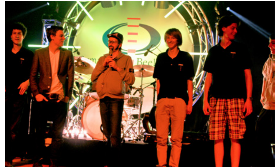
Ook de techniekcommissie mag even op het podium bij de muzikavond!

kennis en Delftse arrogantie in een discussie belandde en onder tafel werd geluld omdat je eigenlijk gewoon geen idee hebt hoe de wereld werkt, was dat best matig. Dat moest anders, dus ik ben een paar jaar geleden ook rechten gaan studeren, als een soort hobby. Dat is een beetje uit de hand gelopen, want komend half jaar ga ik naar de University of Texas School of Law voor mijn master in het civiele recht.