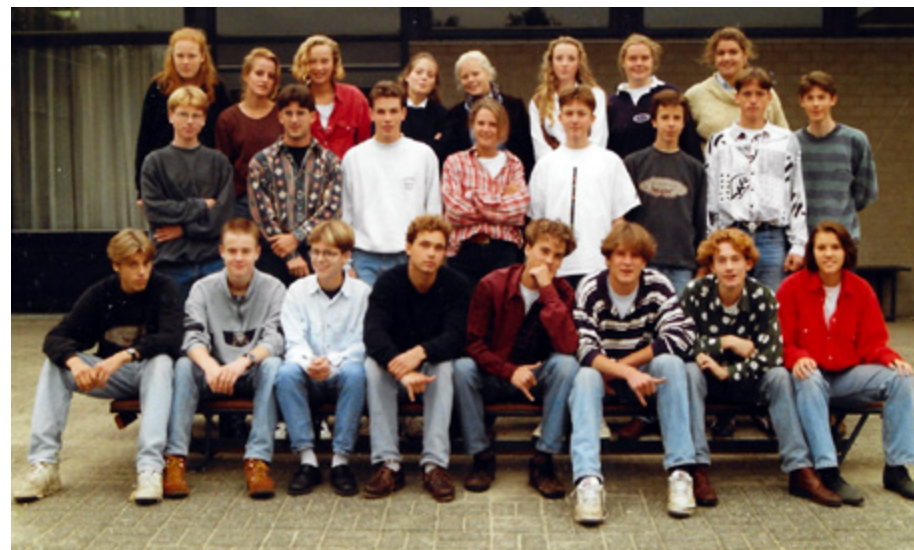
Klassenfoto: Klas 6, 1995

nog steeds de vruchten van. Op de Vrije School werd je niet getest, dus mijn ouders besloten om een Cito-toets te laten doen om een beetje een idee te krijgen op welk niveau het vervolgonderwijs ingestoken kon worden. Ze hebben me niet verteld dat ik getest werd, maar dat ik leuke oefeningen ging maken. De uitslag hebben ze me overigens ook nooit verteld. Daarna zijn we naar een