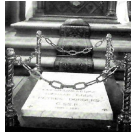
Graf Peerke Donders

Hij waste de melaatsen, verbond hun vaak afschuwelijke wonden en gaf hun zo nodig zijn eigen voedsel en kleding. Naasteliefde was voor Peerke niet een abstract ideaal, doch werk in uitvoering; toen een melaatse in haar laatste levensfase hem zei dat ze graag nog een keer het oerwoud wilde zien, tilde Peerke