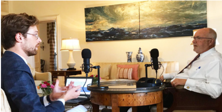
Podcastopname met VS-ambassadeur Pete Hoekstra