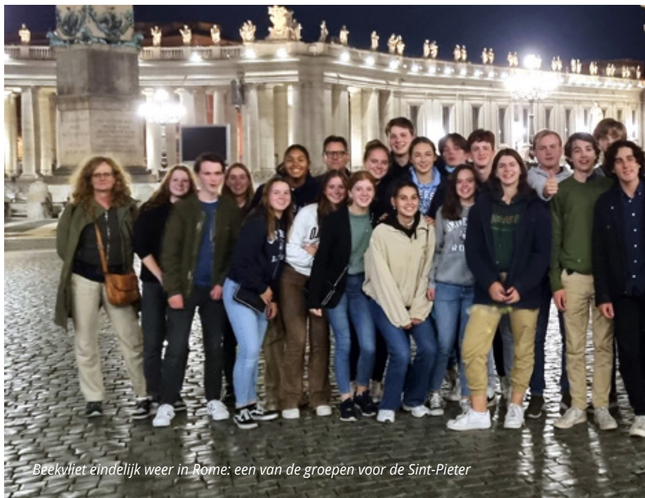
Beekvliet eindelijk weer in Rome: een van de groepen voor de Sint-Pieter