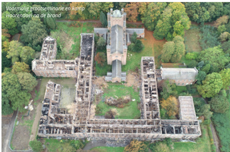
Voormalig grootseminarie en kamp Haarendael na de brand