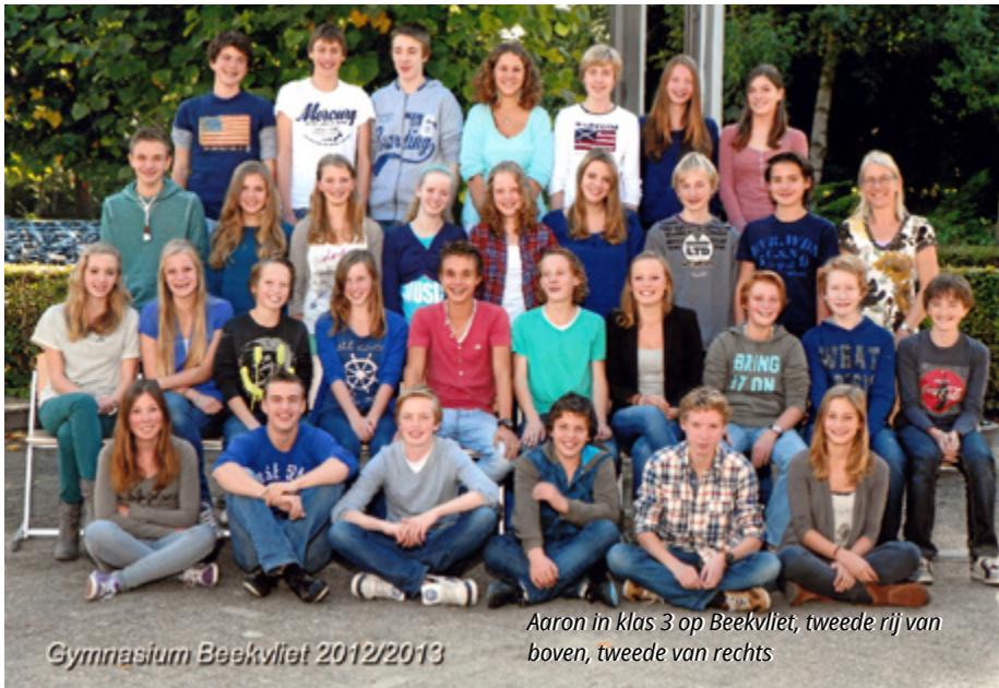
Gymnasium Beekvliet 2012/2013

Als kleine jongen had ik altijd al een brede interesse, met name in geschiedenis, politiek en defensie (of 'het leger' zoals ik dat toen altijd noemde). Geen wonder dat ik op de basisschool altijd met vriend (en toekomstig Beekvliet-klasgenoot) Thorben Elzinga (2016) ging zwaardvechten met houten takken die we ergens in het park vandaan