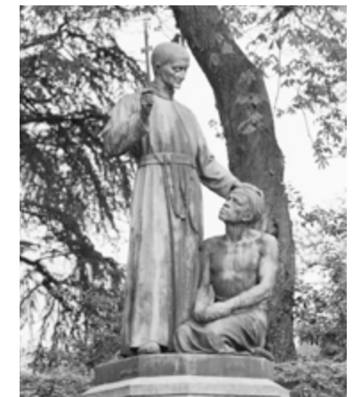
Er is veel commotie geweest over het standbeeld...

Op het kleinseminarie Beekvliet stond, hoog op de lange wand van de grote refter, een borstbeeld van Peerke die vandaar op vele generaties seminaristen heeft neergekeken. Het is in feite vreemd dat in het huidige schoolgebouw van Beekvliet een afbeelding of beeld van Peerke Donders ontbreekt. Ik denk dat we kunnen stellen dat Peerke Donders de meest bewonderenswaardige oud-leerling van Beekvliet is. We zouden alsnog op Beekvliet een beeld van Peerke Donders kunnen neerzetten. Zou Beekvliet deze oud-leerling niet in ere dienen te houden? ★