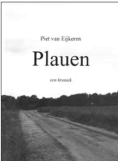
De omslag van Plauen