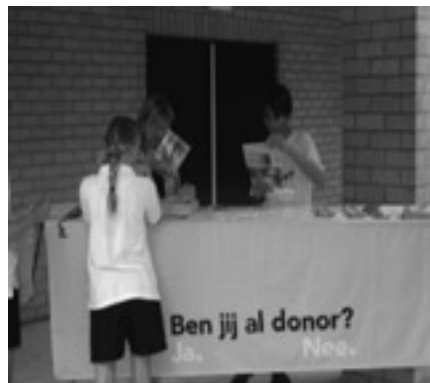
Veel aandacht voor orgaandonatie bij de finish van de donorloop op Beekvliet