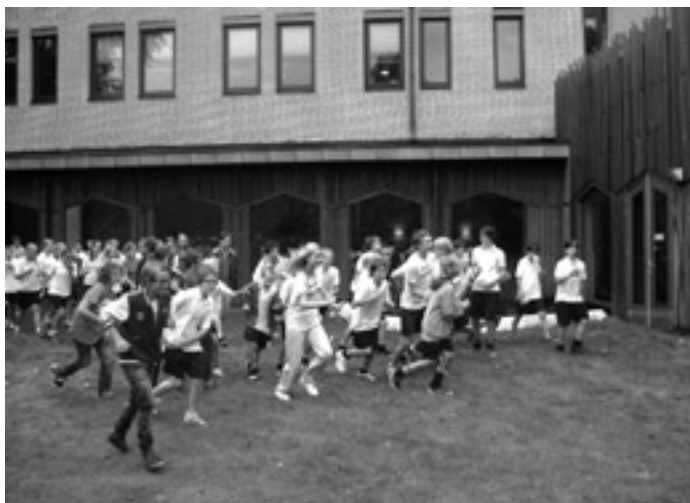
De start van de donorloop bij het gemeentehuis van Sint-Michielsgestel