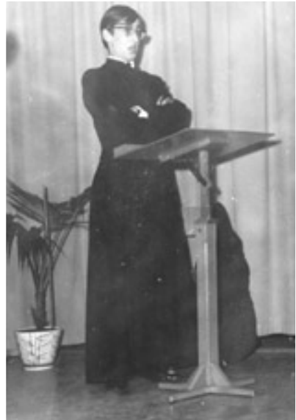
Piet van Eijkeren als cabaretier in 1965