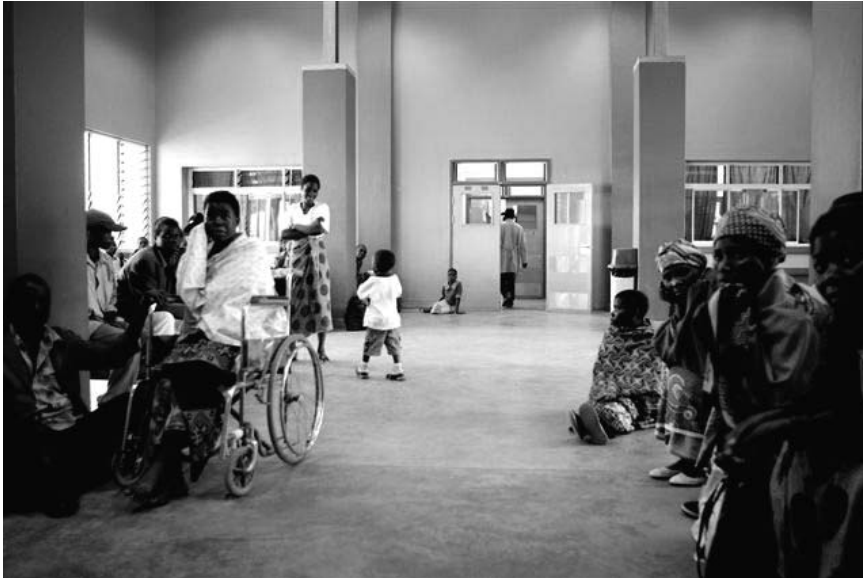
Foyer van het ziekenhuis.