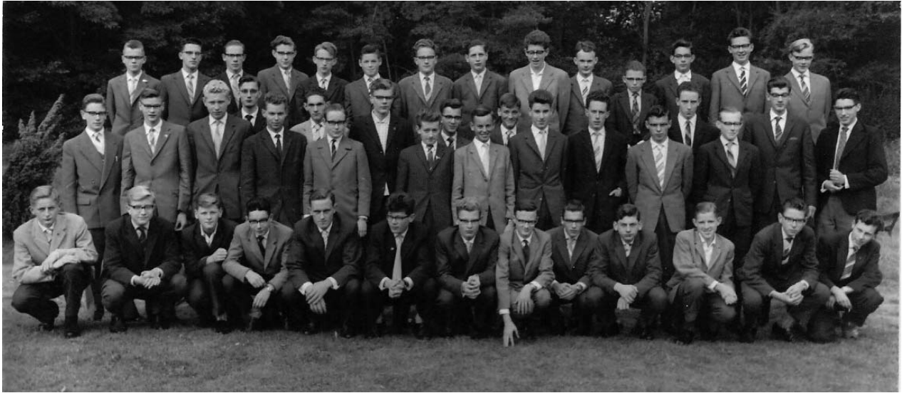
Cours 68, toen nog op Beekvliet als vijfde klas, de Poësis.

Zoals bekend vond in de jaren '60 een grote omwenteling plaats in de priesteropleiding. Een aantal mensen ging in 1965 in Nijmegen filosofie en theologie studeren; een aantal ging in 1967, toen "Haaren" als priesteropleiding werd opgeheven, in Tilburg studeren. In de loop van de jaren 1962-1968 stopte een relatief groot aantal om persoonlijke redenen met de priesteropleiding.