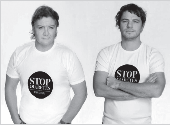
Stichting DON, samen met ambassadeur René Froger

Zeven jaar Beekvliet, zoals gezegd mijn hoogst genoten opleiding, heeft in mij dus niet die voor een studie noodzakelijke eigen verantwoordelijkheid aangewakkerd, maar het is wel een zeer belangrijke basis gebleken voor mijn verdere persoonlijke, zakelijke en maatschappelijke leven. Beekvliet levert niet alleen een uitzonderlijke kwaliteit van onderwijs, maar heeft normen en waarden hoog in het vaandel staan en draagt dit ook uit.