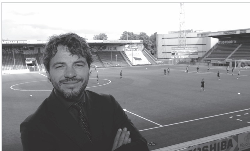
Als voorzitter van de RvC in het stadion van FC Den Bosch

Terugkijkend op mijn 7 jaar Beekvliet ('87 – '94) heb ik moeten concluderen dat het voor mij persoonlijk niet de ideale basis is gebleken voor mijn wetenschappelijke opleiding die daarop volgde. Na drie jaar economie aan de UvA waarin ik welgeteld één tentamen heb afgelegd (wel gehaald overigens, dus toch 100% score wat dat betreft) heb ik mijn heil noodgedwongen bij een hbo opleiding moeten zoeken. Mijn ietwat minderwaardige ondertoon over deze schoolse opleiding komt voort uit het feit dat ik van mening ben dat een hbo opleiding voor een gymnasiast qua niveau toch echt ondermaats is. Wat een decaan of studieadviseur ook anders moge beweren. Zonder veel bloed, zweet en tranen heb ik in 1994 met het redelijke resultaat van een 7 gemiddeld eindexamen gedaan en ik was in de veronderstelling dat ik op eenzelfde wijze ook mijn studie in Amsterdam kon doorlopen. Niets bleek in mijn geval dus minder waar; de redelijk grote mate waarin Beekvliet immer berustte op de eigen verantwoordelijkheid van leerlingen, lag hier onder andere aan ten grondslag. De belachelijk eenvoudige wijze waarop ik vervolgens de Engelstalige studie International Business aan het sinds enige tijd beruchte Inholland te Diemen heb doorlopen, sterkt mijn mening dat een gymnasiast op de universiteit thuishoort. Zeker een van het befaamde Beekvliet!