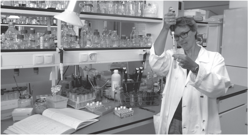
Foto op 30 juni 2014 genomen op mijn werk. In het centrifugebuisje zie je de rood gekleurde anammox-bacteriën. Deze zijn rood gekleurd vanwege de grote hoeveelheid ijzer bevattende cytochromen in de bacteriën. Ik doe een experiment in het kader van het onderzoek naar waar in de cel de bacterie zijn energie (ATP) maakt.

lijk huis in Rosmalen waar we wonen. Heerlijk in de natuur in de grond wroeten, dat is mijn ontspanning!