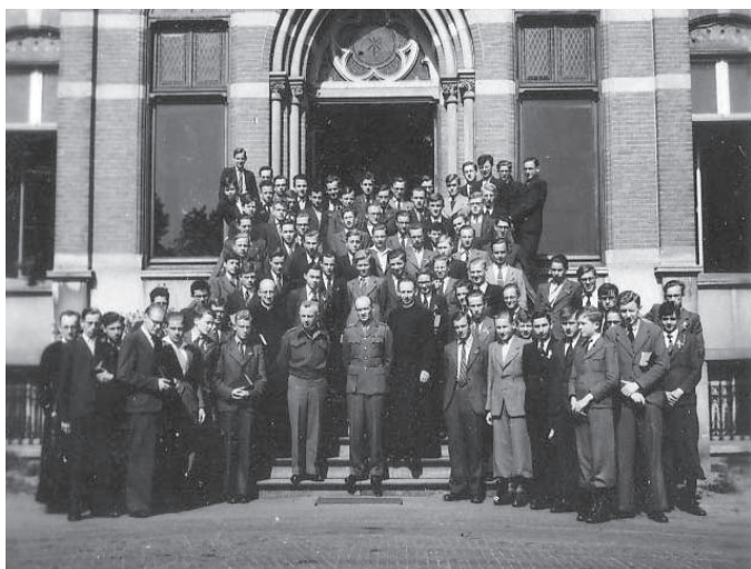
Terugkeer van de studenten en leraren op Beekvliet 1945

Soms werden gegijzelden in de nachtelijke uren gewekt met de boodschap dat ze verkast werden. “Het was best angstig als we ‘s nachts die zware laarzen van de Duitsers hoorden. Kwam hij naar ons of liep hij verder? Op een dag werden portretfoto’s gemaakt van 58 personen, ook van mij. Je ziet aan onze gezichten en de blik in de ogen dat er angst is voor executie. Twee ervan zijn wel vroegtijdig afgevoerd. Een dag later moesten we op het voetbalveld aantreden en hoorden we wie entlassen waren. Dan heerste er een bedroefde stemming. Ik weet nog dat