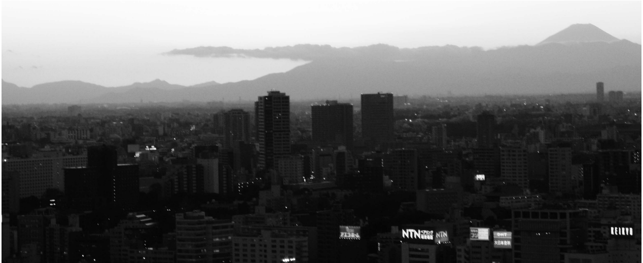
De skyline van Tokyo

lukte bleek voor duizenden anderen in Japan niet meer te zijn weggelegd. Na thuiskomst werd ons de omvang van al het natuurgeweld pas echt goed duidelijk bij het zien van de inmiddels bekende tv-beelden die de hele wereld over zijn gegaan. Wat je dan denkt en voelt is met geen pen te beschrijven. Veel tijd om hierbij stil te staan was er echter niet. De inwoners van Tokyo raakten lichtelijk in paniek en zo gingen ook wij op hamstertocht voor voedsel en water. Hoewel we de situatie redelijk onder controle hadden werden we vier dagen later teruggehaald door Peter's bedrijf wegens de nucleaire situatie die steeds ernstigere vormen dreigde aan te nemen. Achteraf gezien net op tijd.