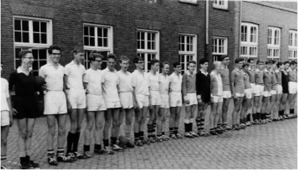
Mgr. Bekkers-toernooi 7 juli 1964