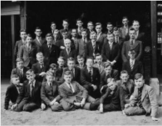
De Smousenhoek met seminaristen uit Eindhoven/Helmond en omgeving

Leden v/d Eindhovensche hoek. De naam Smousen vanwege de vele joodjes die in Eindhoven schijnen te zitten. Deze hoek omvat Eindhoven, Helmond, 't land van Peel en Kempen, etc. (...)