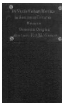
De kaft van De Variis Verbis et Moribus