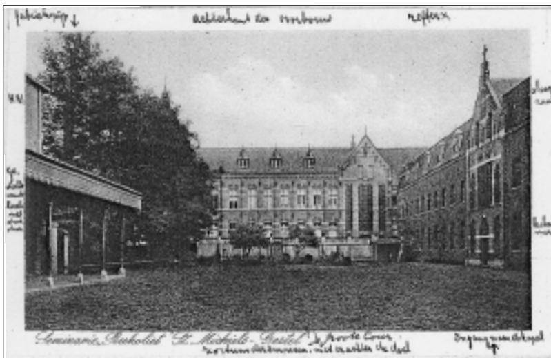
De Grote Cour

De leden der Bossche hoek. Deze hoek omvat 's-Hertogenbosch (hoofdplaats) en Vught; naar omstandigheden ook: Orthen, Hintham en Cromvoirt. Sinds 1910 vormen zij een zelfstandige hoek; daarvóór waren ze ingedeeld bij de Bokken. Vroeger heetten zij Broodhonden; waarmede deze naam verband houdt of afgeleid is, is niet bekend.