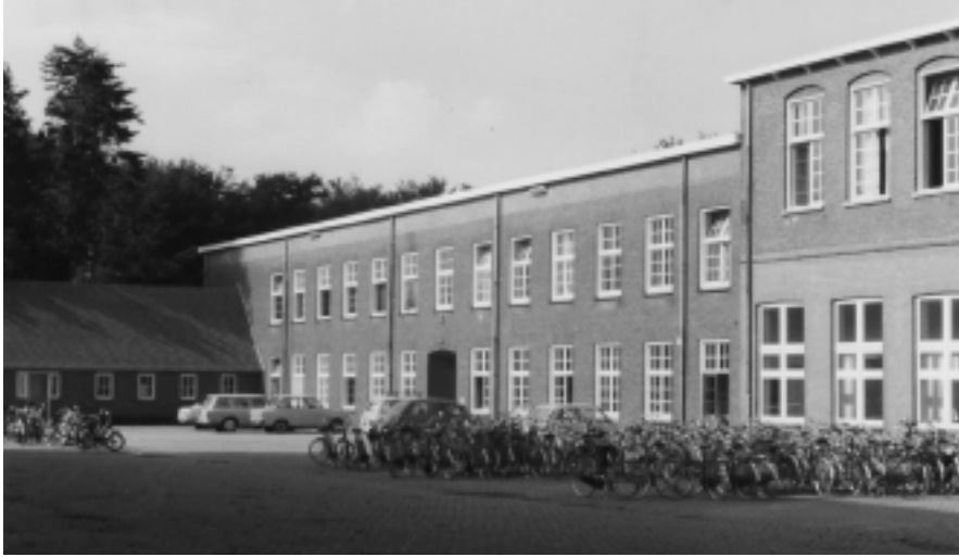
De Duitse Bouw in de jaren '70 van de vorige eeuw.

Arbitrair, zonder duidelijke spelregels en zonder bescherming voor het individu. Van ogenschijnlijk willekeurige beslissingen afhankelijk. Niet menswaardig dus. Maar wel beschikten de gijzelaars over de mogelijkheid om lezingen te organiseren, aan sport te doen, en zelfs een krant uit te geven tot deze, "Adam in ballingschap", eind januari 1943 verboden werd. Uit verschillende bronnen blijkt dat het verschijnen van dat eigen kampblad van grote betekenis is geweest voor de gijzelaars en wellicht van grotere betekenis dan de vele kranten waarover wij beschikking hadden. Verder ontstonden er ook gespreksgroepen, onder meer over het vernieuwen van de maatschappelijke verhoudingen in Nederland, over het opbouwen van een nieuwe toekomst.