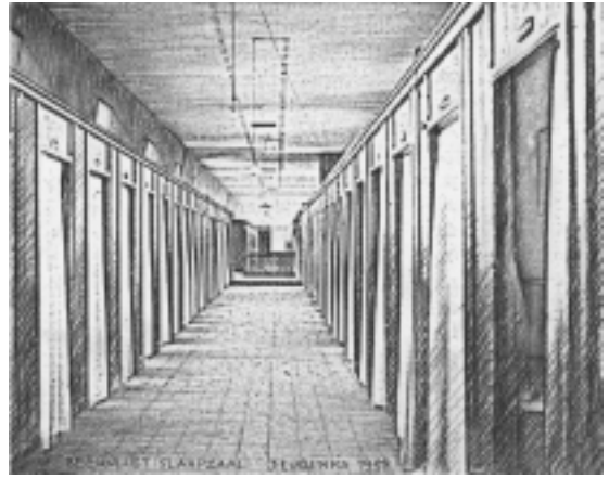
De grote slaapzaal van seminarie Beekvliet (tekening Jan Lurinks)

studiezaal, de recreatiezaal, en de speelplaats. De refter, een brandschone eetzaal, die door de vaardige handen van de inwonende nonnen al in gereedheid is gebracht voor de eerste maaltijd. Zoekend lopend tussen de vele lange tafels door wordt de eigen servetring ontdekt. Ook deze plek zal driemaal daags vereerd worden met een bezoek.