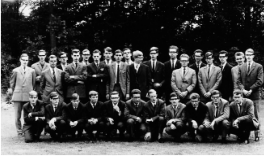
Rhetorica juni 1966