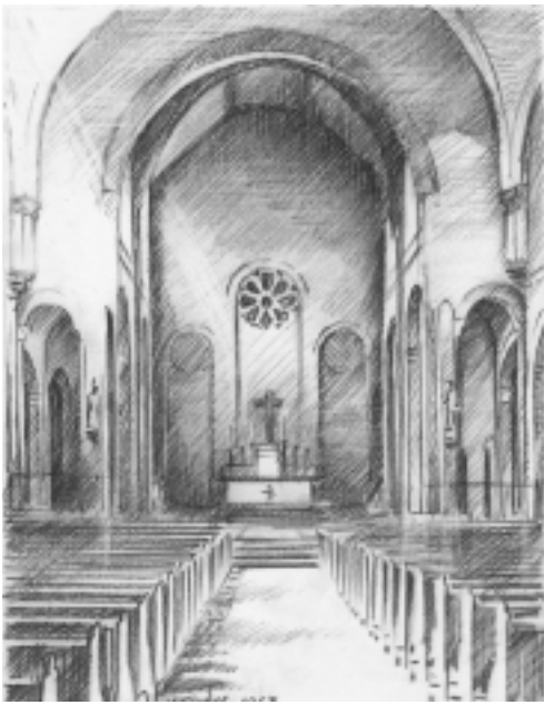
De kapel van Beekvliet in 1963 (tekening Jan Lurinks)

en wetten, luisteren en gehoorzamen, opletten en studeren, maar ook van sporten en wandelen, je vermaken en kletsen met elkaar en als het nodig geacht wordt, dit ter beoordeling van de priestersurveillanten en de heren professoren, stevige uitbranders en tucht. De bel luidt een gang naar de kapel in. Binnen spreekt de regent mooie woorden van welkom en wensen van succes en bidt voor Gods zegen over ons allen.