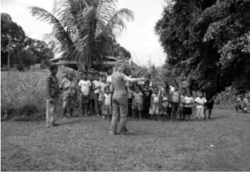
Vorbereiding scène in Indianendorp in Suriname

beelden. Het werd Theater-, Film- en Televisiewetenschappen aan de Universiteit van Utrecht in 1993.