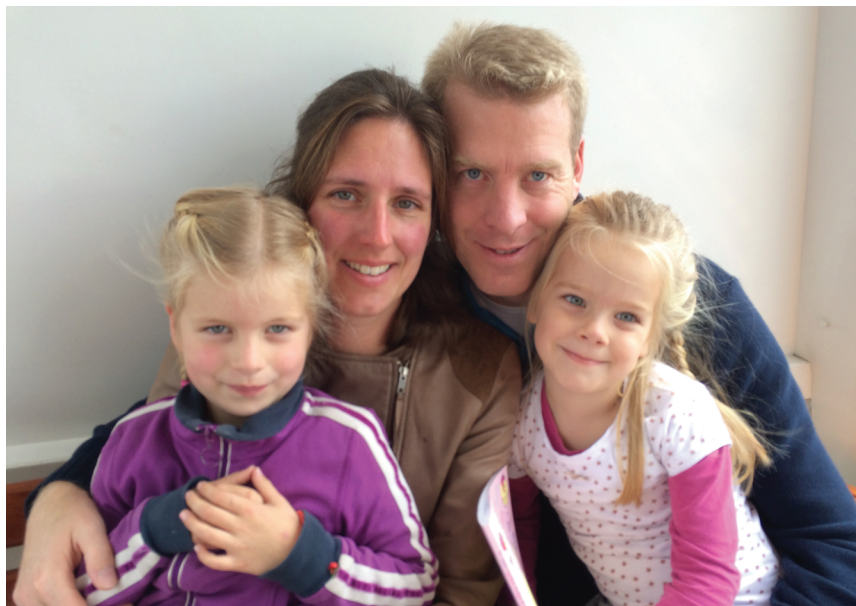
Het gezin Taks

Sinds 2011 ben ik bovendien samen met mijn vader bezig om Dommelstroom vorm te geven, ons initiatief om het water van de Dommel als duurzame energiebron te gaan gebruiken. Dommelstroom wordt de eerste coöperatieve waterkrachtcentrale van Nederland. De gemeente Sint-Michielsgestel en het