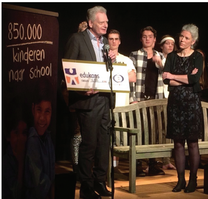
De overhandiging van de cheque aan Edukans

gepresenteerd. Uiteraard is er ook ruimte voor een sociaal programma met activiteiten waarin de cultuur van het gastland tot uiting komt. De twee groepen van elk 10 vierdeklassers die inmiddels hun bezoek naar Duitsland en Zweden erop hebben zitten, waren erg enthousiast. Zij werken nu mee in de voorbereidingen op de volgende bijeenkomst die in november op Beekvliet wordt gehouden. In maart 2017 staat Schotland op het programma.