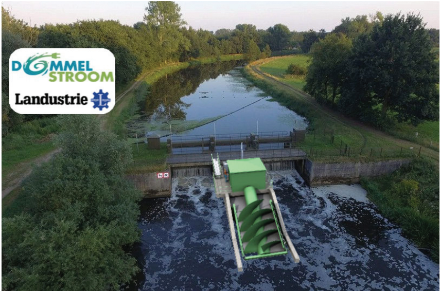
Montagefoto van de waterkrachtcentrale in de Dommel

centrale geen gevaar op; de schroeven van de waterkrachtinstallatie worden zo gemaakt, dat vissen er gewoon omheen kunnen zwemmen.