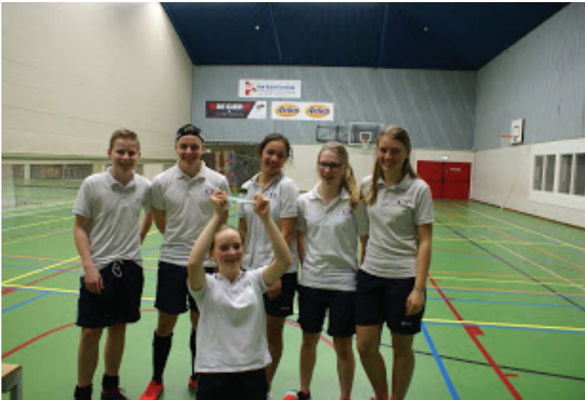
Het winnende cricketteam

Beekvliet heeft natuurlijk een sportieve historie, maar de sport cricket was daarbij een beetje in de vergetelheid geraakt. In de week dat in de plaatselijke Gestelse krant toevallig een stukje verscheen over cricket op Beekvliet in ver vervolgen tijden, begon een groep enthousiaste leerlingen op uitnodiging van cricketvereniging MOP aan drie gasttrainingen op vrijdagmiddag op school. Onder leiding van professionele crickettrainers werd, na een goede uitleg over de spelregels en techniek, fanatiek geoefend. Niet voor niets, want op vrijdag 19 februari werd vervolgens in de Martinihal in Vught deelgenomen aan de Cambridge Cup. De finale daar ging uiteindelijk tussen de twee Beekvlietteams die van de organisatie de teamnamen 'Engeland' en 'Australië' hadden meegekregen. Zo werd in Vught 'The Ashes', de beroemde en zeer beladen wedstrijd tussen deze twee landen, in het klein nagespeeld. Team 'Australië' won de finale; de trofee staat inmiddels te pronken in onze prijzenkast.