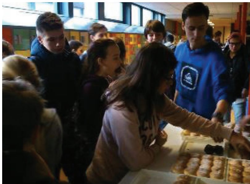
Traktatie voor de Beekvlietleerlingen