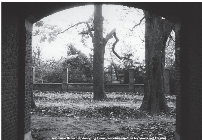
Seminarie Beekvliet, doorgang kleine cour Kastanjelaan tegenover het kerkhof