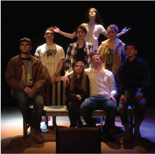
De cast van het kerstoneelstuk (allen klas 6)

schoolleiding. In het afsluitende gesprek waren ze lovend over zowel de kwaliteit van het onderwijs als de betrokkenheid van de medewerkers en leerlingen bij de school; de vakkennis van de docenten en de actieve houding van de leerlingen in de lessen werden speciaal genoemd. Beekvliet is erg content met deze bevindingen; het definitieve inspectierapport ontvangen we een dezer dagen.